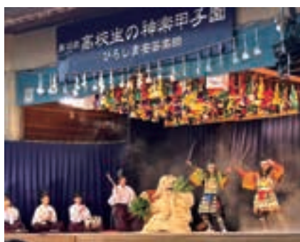
▲広島新庄高校(悪狐伝)