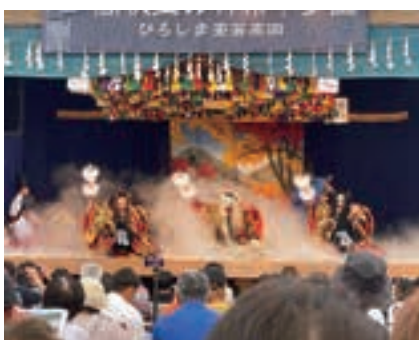
▲千代田高校(紅葉狩)